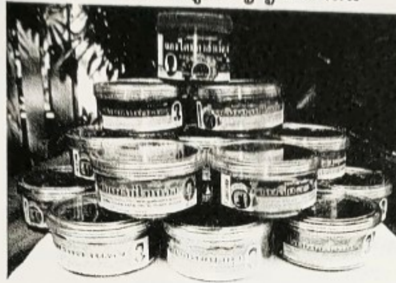
ผลิตภัณฑ์จากภูมิปัญญาท้องถิ่น