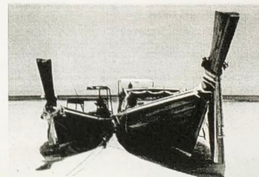
เรือหัวโทง