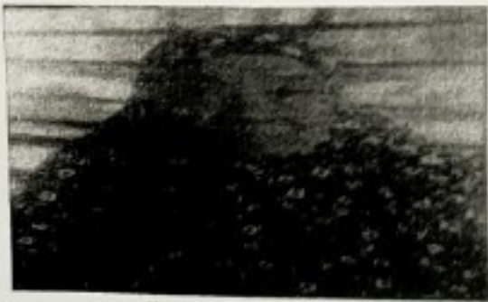
3. นางย่าเหี้ย สันสมุทร (เหี้ย) ภูมิปัญญานวดแผนไทย 20 หมู่ที่ 4 (เกาะหมากน้อย) ตำบลเกาะปันหยี อำเภอเมือง จังหวัดพังงา ประสบการณ์ด้านภูมิปัญญา 20 ปี