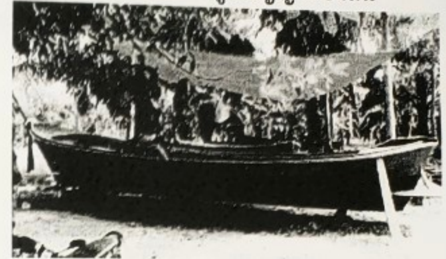
ผลิตภัณฑ์จากภูมิปัญญาท้องถิ่น