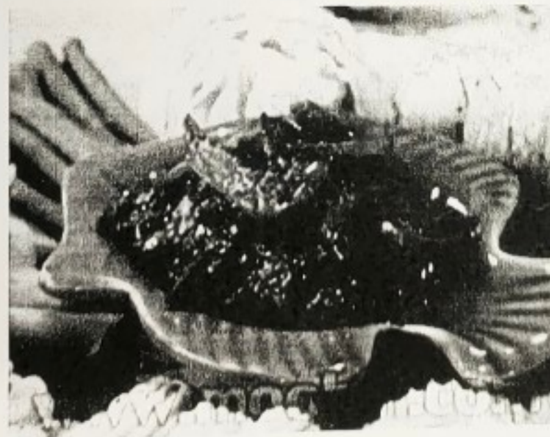
กะปิและอาหารแปรรูปจากกะปิ