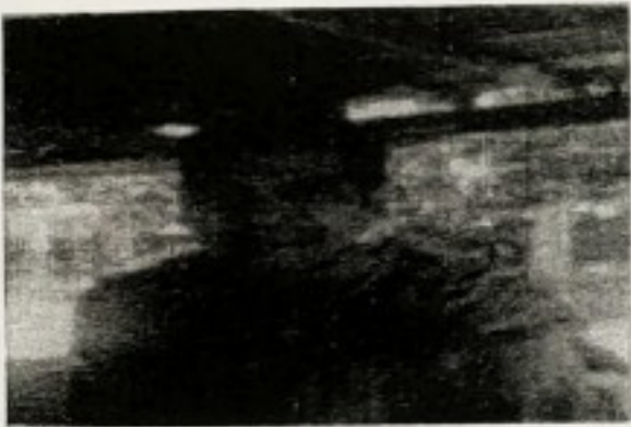
2. นายห้าหลี กองสิน (หลี) ภูมิปัญญาทำเรือหัวโทง 46/1 หมู่ 3 (เกาะไม้ไผ่) ตำบลเกาะปันหยี อำเภอเมืองจังหวัดพังงา ประสบการณ์ด้านภูมิปัญญา 40 ปี