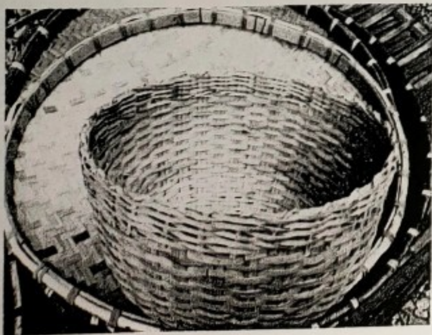
จักสานไม้ไผ่